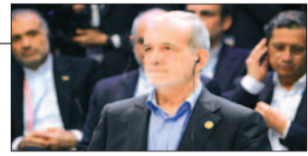
ईरान के राष्ट्रपति मसूद पेजेशकियन

ईरान के राष्ट्रपति मसूद पेजेशकियन का कहना है कि उनका देश अपने परमाणु कार्यक्रम का किसी भी तरह का निरीक्षण कराने को तैयार है और स्पष्ट किया कि तेहरान परमाणु हथियार के पक्ष में नहीं है। ईरान को इस्लामिक क्रांति की 47वीं वर्षगांठ के उपलक्ष्य में आयोजित कार्यक्रम के दौरान उन्होंने कहा कि हम परमाणु हथियार हासिल नहीं करना चाहते। हमने यह बार-बार कहा है और किसी भी तरह के सत्यापन के लिए तैयार हैं। उन्होंने कहा कि इस मामले में ज्यादा मांगों के आगे नहीं झुकेंगे। अमेरिका और यूरोप ने अपनी बातों और बयानबाजी से संदेश की ऊंची दीवार खड़ी कर दी है, जिससे